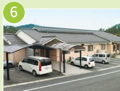
グループホーム びっちゅう