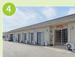
グループホーム北畝