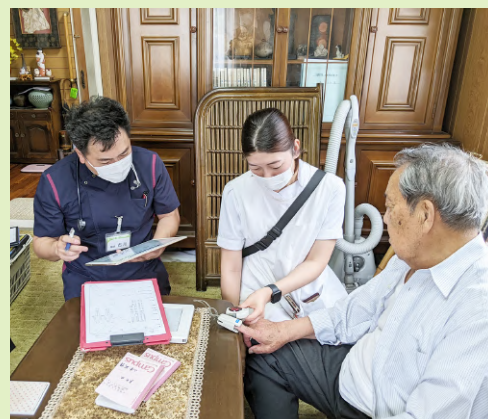
▲ 医師、看護師、ケアマネージャーと共に