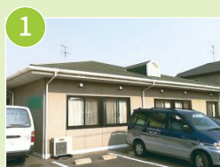
グループホームうらら