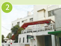
グループホーム友愛