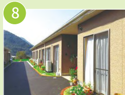
グループホーム 高梁 2 号館