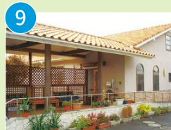
グループホーム サンバード茶屋町