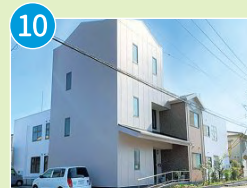
グループホーム みつばちハウス