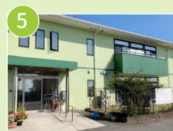
グループホーム大福