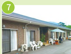
グループホーム 高梁