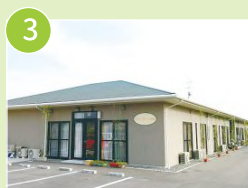
グループホーム西坂